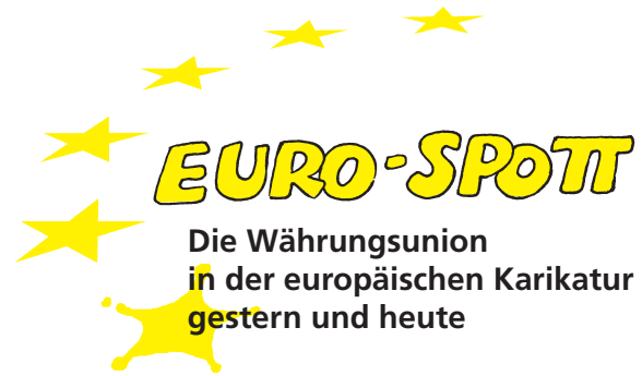
Zeichnungen: Dieter Hanitzsch

EURO-Lust und EURO-Frust, EURO-Euphorie und EURO-Skepsis - die Ausstellung blickt durch die humorvoll-scharfe Brille europäischer Karikaturisten, wie Dieter Hanitzsch, auf die Entstehungszeit des EURO. Sie stellt Erwartungen, Visionen und Kritik aus den 90er Jahren der aktuellen Krise gegenüber.