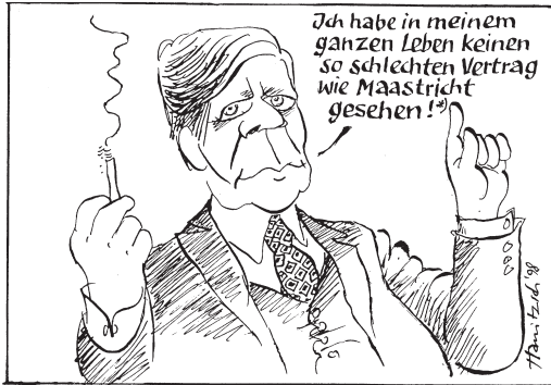
*) Originalzitat Helmut Schmidt